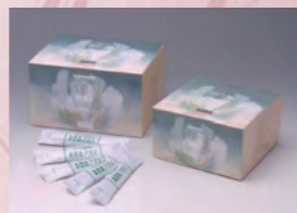
1989年 SOD 様作用食品の商品名が社名 と同じ「AOA アオバ」となり、 60包入りから90包入りへ増量 された。