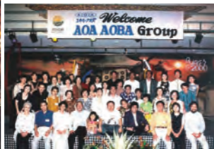
アオバのモットーは「仕事は楽しく、遊びは真剣に」。ツアーではいつも笑顔がいっぱいです。