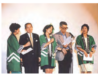
アオバ役員と丹羽博士による「アオバの唄」熱唱

第10回全国大会 フランス国際予防協会のクロアレック博士が来日。脳内モルヒネの働きを