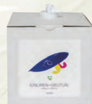
2020年 「IONUREN-DEUTUN 5ℓ」 「IONUREN-DERON 80mℓ」 新たな仲間が加わりました。