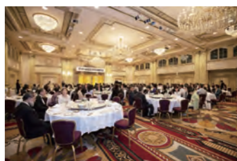
たくさんのお客様にご列席いただきました。