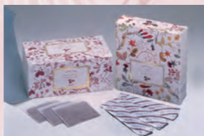
1989年 レイボス AOA ティースーパーの発 売開始。