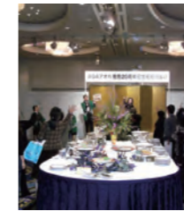
アオバ創立20周年「感謝の集い」

アオバ創立満20周年を記念して、東京と福岡で「感謝の集い」を開催 アオバの原点に戻り、AOAアオバをご愛用いただいているお客様とともに20周年をお祝いしました。その後、真の健康を目指すコミュニティ作りを目的に、アオバミロクシステムを導入。2010年から現在につながりました。