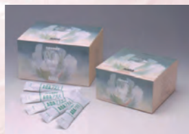
1990年 「AOA アオバ」はさらに増量し、 120包入りへ。