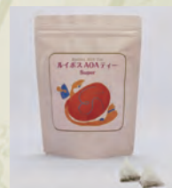
2017年 「レイボス AOAティースーパー」のパッケージを変更。