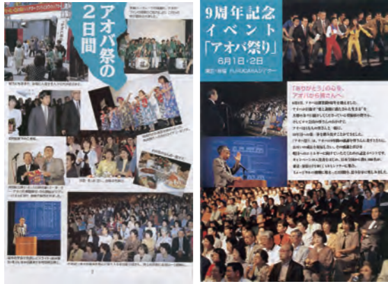
9周年記念イベント「アオバ祭り」

劇団「ふるさとときやらばん」と合同で、「アオバ祭り」を開催し、約1000人のお客様をお迎えすることができました。