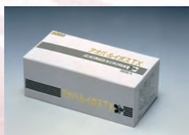
1992年 アオバレイボス TX の販売を開始。