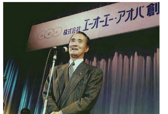
ステージでの突然の長嶋さんのスピーチに、お客様は大喜び

劇団「ふるさとときやらばん」と合同で、「アオバ祭り」を開催し、約1000人のお客様をお迎えすることができました。