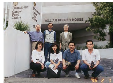
研修ツアーでオーストラリア国立がんセンターへ

社員のオーストラリア研修ツアーでは、紫外線と皮膚がんの関係について、国立キャンサーセンターにて、生の学習をさせていただきました。