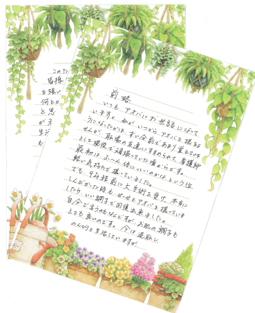
大阪府在住 60代女性

いつもアオバにお世話になっています。私がいつからアオバを摂るようになったかは、随分前であまり覚えていませんが、職場の友達にすすめられて、看護師として現役で頑張っていた頃からです。最初は、ふ〜ん、体にいいのかなというくらい軽い気持ちで摂っていました。でも、9年程前に大手術を受け、本当にしんどかった時も、せっせとアオバを摂っていましたら、いい調子で回復出来ました。自分で言うのもなんですが、お肌の調子もとても良いのです。今は退職し、のんびりと生活していますが、このたびの新型コロナ騒動で皆様同様、日常生活など、不自由を強いられ大変です。何とか皆の力で乗り越えていければ！と思っています。そのためには、まず自分が元気であらねばと再度確信し、食生活もできる限り栄養をとり、アオバもしっかり毎日摂って頑張ろうと思っています。まだ出口が見えてこないようですが、できるだけ規則正しい生活、食事、睡眠等守っていきます。長々書いてしまいましたが、アオバへの感謝を込めてお伝えしました。今後もしよろしくお祈りします。