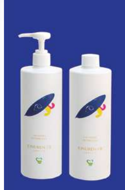
LAUNDRY DETERGENT IONUREN-DE イオヌレン-デ